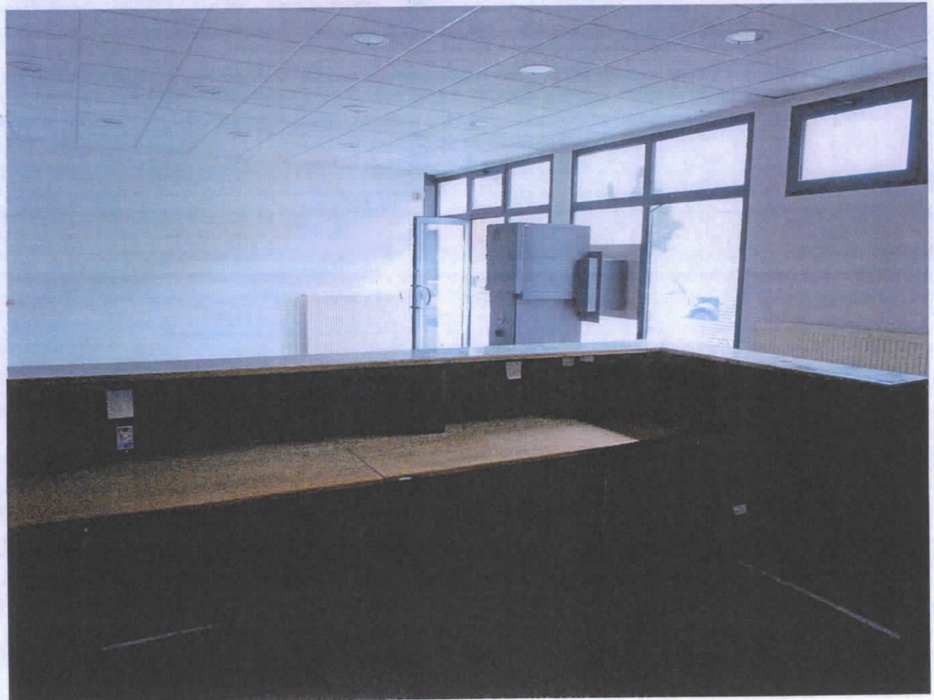
Papa, Deak Terenc u. 1. Pr. 10.