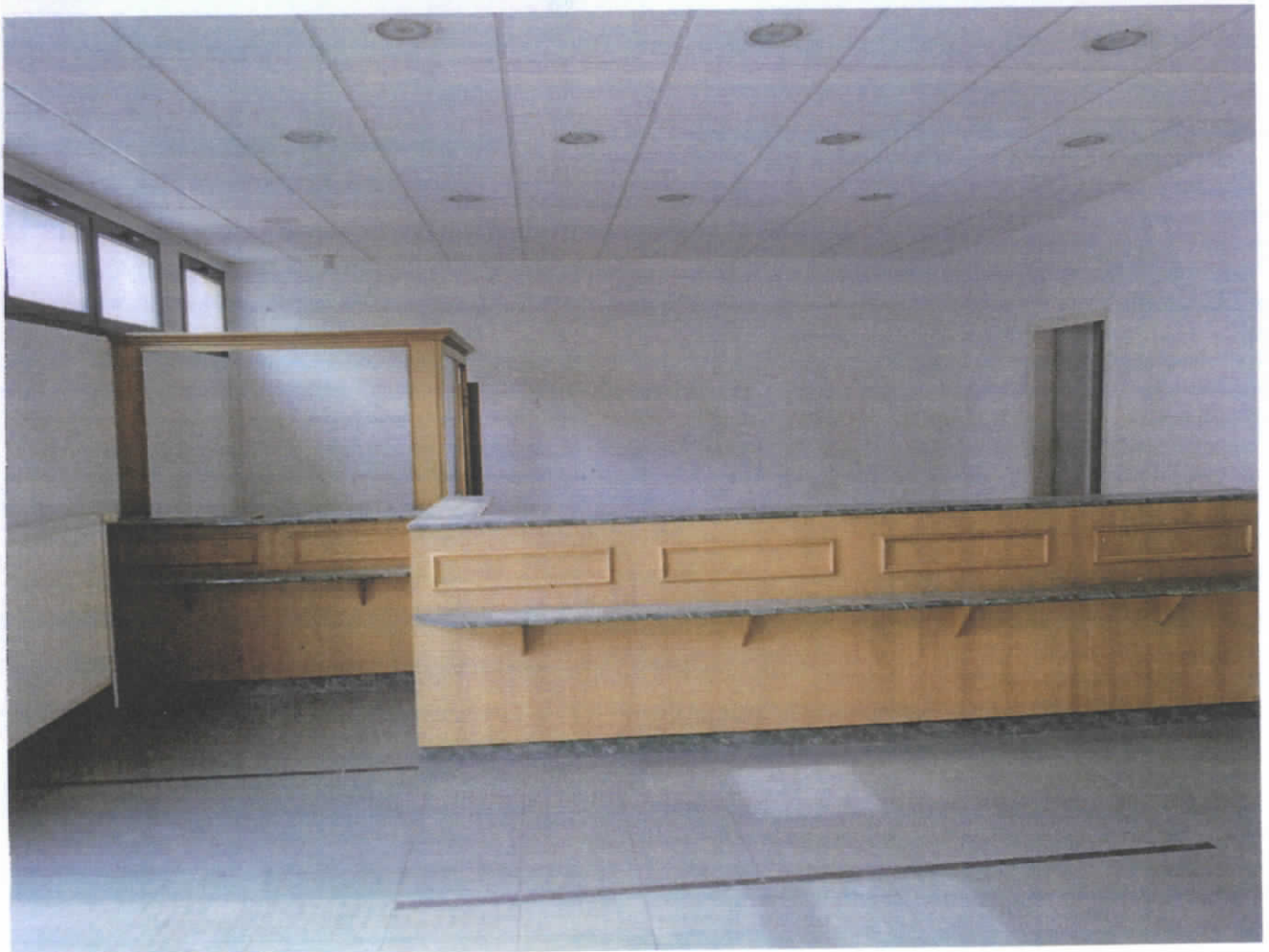
Pápa, Deák Terence u. 1. sz. 10.