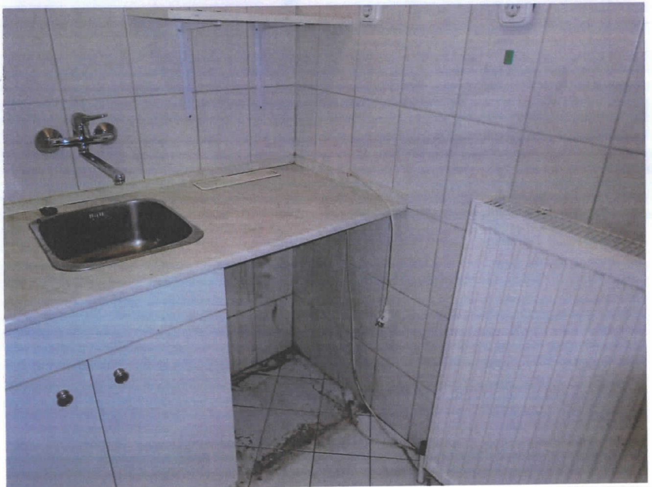
Pada Desk Terasa u. 1. No 10.