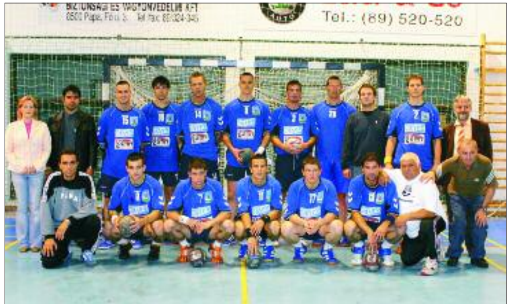
Az Elmax Vasas férfi kézilabdacsapata