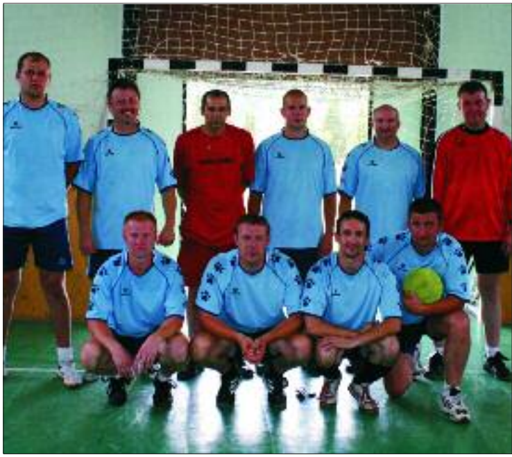
A Pápai Rendőrkapitányság csapata

A gyermeknap keretében a kicsiket közös játékok